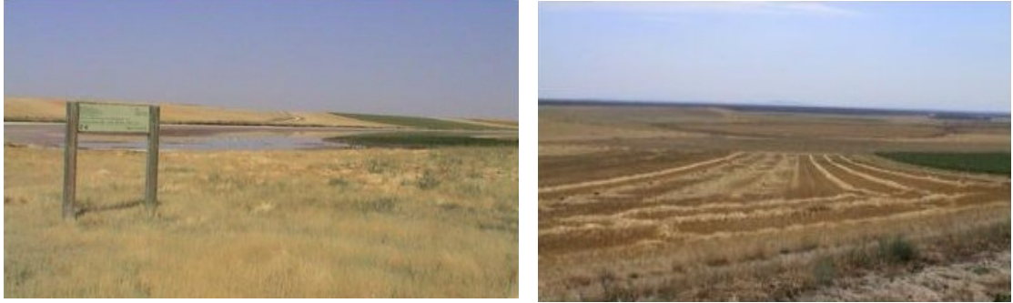
Figuras 3 y 4. Humedales de Las Eras y La Iglesia, Villagonzalo de Coca, (Segovia).